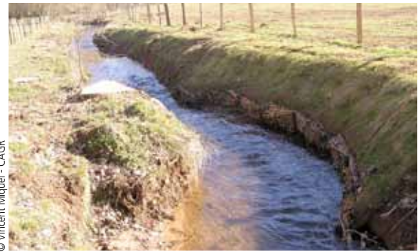
Deux mois après les travaux : les peupliers ont été abattus et les souches d'arbres présentes dans le lit mineur ont été placées sur le côté de la berge afin de redonner une légère sinuosité au cours d'eau. Février 2011

des aménagements de diversification et de la reprise de la végétation plantée sur le site restauré. Aucun suivi scientifique n'a été mis en place.