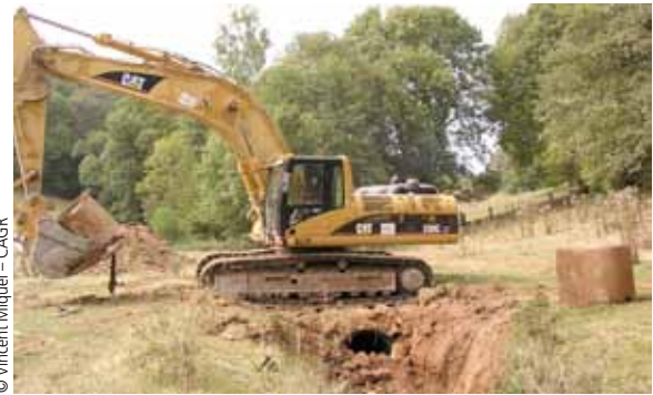
Enlèvement de la succession de buses sur le Trégou. Automne 2010

Le site des travaux n'a pas fait l'objet d'un état initial. Depuis les travaux de restauration, le technicien de la COR effectue un suivi visuel régulier pour vérifier l'évolution de la pente, des processus d'érosion,