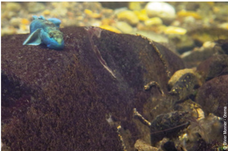
Migrateurs amphihalins d'une rivière de Martinique. Poisson du genre Sycidium et crustacés du genre Atya .

Pourtant, alors que l'effort de recherche et développement mené dans les DOM depuis 2008 a permis le développement d'un ensemble d'indicateurs validés (Réunion, Antilles) ou en cours de développement (Mayotte) pour les autres EQB pertinents, diatomées et invertébrés benthiques 1 , la boîte à outils reste aujourd'hui peu garnie pour l'EQB poissons : en 2015, seule