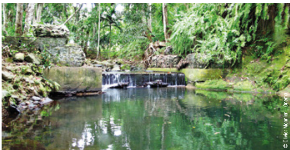
Seuil sur une rivière de Mayotte, une pression sur la continuité écologique.

Enfin, les dégradations de l'état sanitaire des eaux (charge bactérienne, virale ou parasitaire) ne font