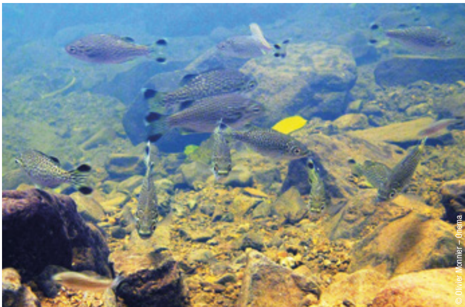
Poissons du genre Kuhlia , migrants amphihalins des rivières de Mayotte.

Le GT a listé un ensemble d'effets pathogènes (lésions organiques, perturbations endocriniennes, troubles