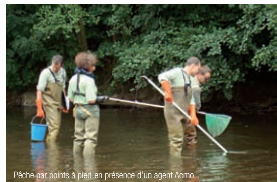
Pêche par points à pied en présence d'un agent Acmo.

La pêche électrique est une activité bien connue à l'Onema, dans les départements et dans les délégations régionales. La question est aujourd'hui d'en généraliser la pratique sur la base d'une méthode et d'un protocole partagés par tous et répétables. L'objectif est bien d'obtenir une image fiable des populations de poissons, alors que les échantillonnages sont pratiqués par différentes équipes. C'est un défi pour tous ceux qui sont impliqués dans ces recueils. Pour Christian Jourdan, responsable du système d'information sur