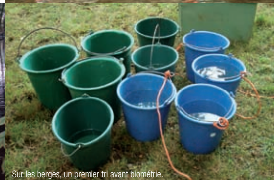
Sur les berges, un premier tri avant biométrie.