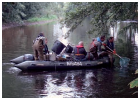
Pêche par points en bateau sur la Bruche : respecter le protocole.