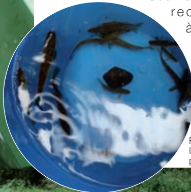
Regrouper les poissons par classe.