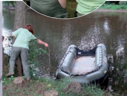
La mise à l'eau du bateau, une contrainte pour le choix des stations.