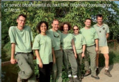
Le service départemental du haut Rhin, l'ingénieur connaissance et l'Acom.