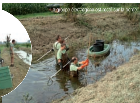
Le service départemental du haut Rhin, l'ingénieur connaissance et l'Acom.