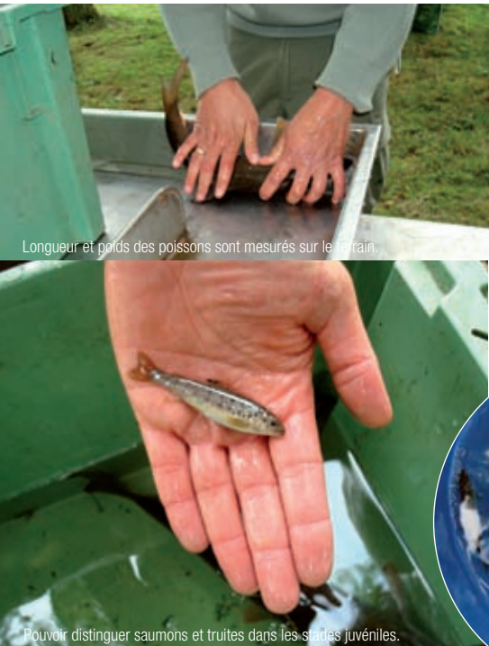
Longueur et poids des poissons sont mesurés sur le terrain.

Actuellement nous réfléchissons à la représentativité de telles données, dont le programme est fixé en début de saison alors que des événements de toutes natures peuvent impacter le résultat. Pour le système d'information sur l'eau, la qualité de l'échantillonnage des masses d'eau est essentielle : quel investissement raisonnable faire pour obtenir des données fiables, qu'elles soient destinées au rapportage à Bruxelles ou à l'information des citoyens ? Il est certain que les agents techniques de l'Onema, qui sont formés à une méthodologie commune à travers les ingénieurs connaissances en directions régionales, ont une connaissance des masses d'eau échantillonnées qui garantit la qualité des données de pêche recueillies. Contrairement à ce qui est fait pour les données physico-chimiques, la DCE n'a pas encore d'exigences précises sur les méthodologies de pêche pour le compartiment « poisson ». Mettre en place une formation via les compétences des personnels de l'Onema nous permettrait me semble-t-il de nous y préparer.