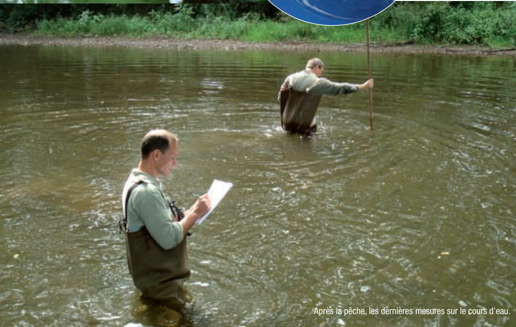
Après la pêche, les dernières mesures sur le cours d'eau.